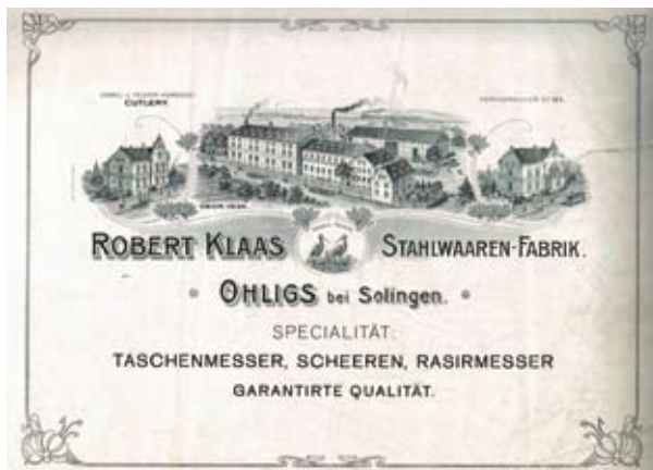
Aus dem Archiv Büchsenmacher/Messer und Schere